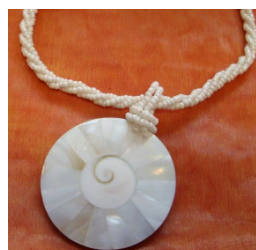
Perlmutterkette aus Vietnam 8,95 €