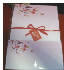
Briefpapier mit Umschlägen 5,20 €