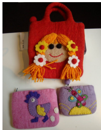
Filzkindertasche aus Nepal 12,50 € Geldbörsen 4,90—5,90 €