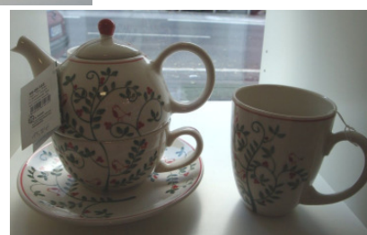
Teekanne mit 2 Tassen Thailand 15,90,€

An den Samstagen im Advent ist der Laden von 10 bis 18 Uhr geöffnet ! Samstag 29.12. Großer Buchverkauf