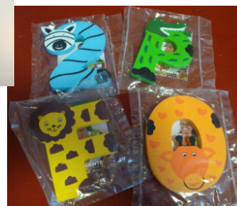
Buchstaben aus Sri Lanka 0,95 €