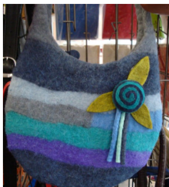
Filztasche aus Nepal zu je 19,50 €